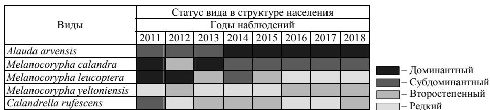
Рис. 1. Межгодовая динамика структуры доминирования сообщества жаворонков на территории Прикаспийской низменности в Александрово-Гайском районе Саратовской области

Межгодовая динамика структуры доминирования сообщества жаворонков, изученная на четырех ключевых участках в Прикаспийской низменности в Александрово-Гайском районе, представлена на рис. 1. Видно, что с 2011 по 2013 г. доминировали вместе, либо попеременно степной и белокрылый жаворонки, а с 2014 по 2018 г. доминирование перешло к полевому жаворонку.