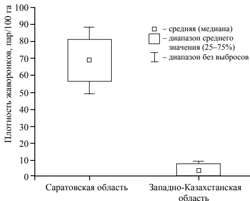
Рис. 5. Динамика плотности полевого жаворонка в Саратовской области и Западно-Казахстанской области

Таким образом, за восьмилетний период исследований, проведенных в Прикаспийской низменности Саратовской области и Западно-Казахстанской области Республики Казахстан, удалось собрать материал, на основании которого были сделаны статистические описания многолетней динамики гнездового населения жаворонков. Установлено, что в Саратовской области наблюдаются тенденции снижения плотности у четырех видов: степного, белокрылого, чёрного и серого жаворонков. Максимальное ее снижение отмечено в саратовской части Прикаспийской низменности у белокрылого жаворонка ( T_{пр} = -28.4\% ). В казахстанской части ареала исследованного сообщества птиц максимальный отрицательный темп прироста ( T_{пр} = -99.9\% ) зарегистрирован