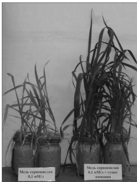
Рис. 2. Влияние гумата на растения пшеницы при 100 мкМ \text{CuSO}_4 в среде

рующую функцию при повышении концентрации токсичного иона. При 500 мкМ роль гумата незначительна, а при 1000 мкМ наблюдается противоположный эффект – усиление накопления меди растениями. Таким образом, протекторная роль гумата ограничивается концентрацией \text{CuSO}_4 250 мкМ.