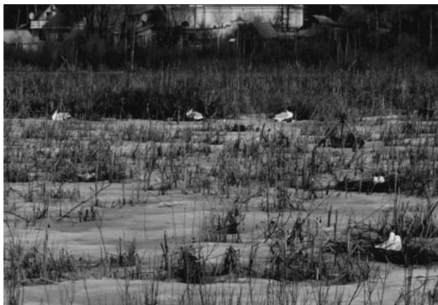
Рис. 1. Расположение макетов озёрных чаек в натуральную величину (на переднем и среднем планах) и профилей суперчаек (3 крупных фигуры озёрных чаек на заднем плане) на Центральном острове весной 2013 г.

Эксперименты по привлечению чаек проводились в апреле – мае 2011 – 2015 гг. (рис. 1). Макеты озёрных чаек в натуральную величину были изготовлены из гипса и раскрашены под натуральных птиц. 14 апреля 2011 г. на Центральный укрепленный остров было выставлено 30 макетов, имитирующих гнездящихся птиц. Недалеко от макетов была помещена акустическая установка (Звонов, 2009),